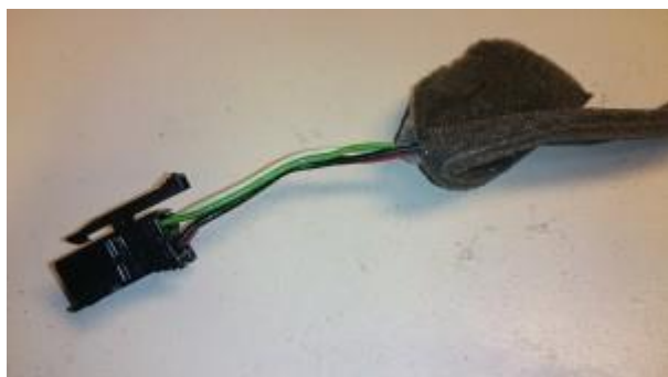
Anslutning för AEM, bakom lucka vid golvet till höger i bagage.